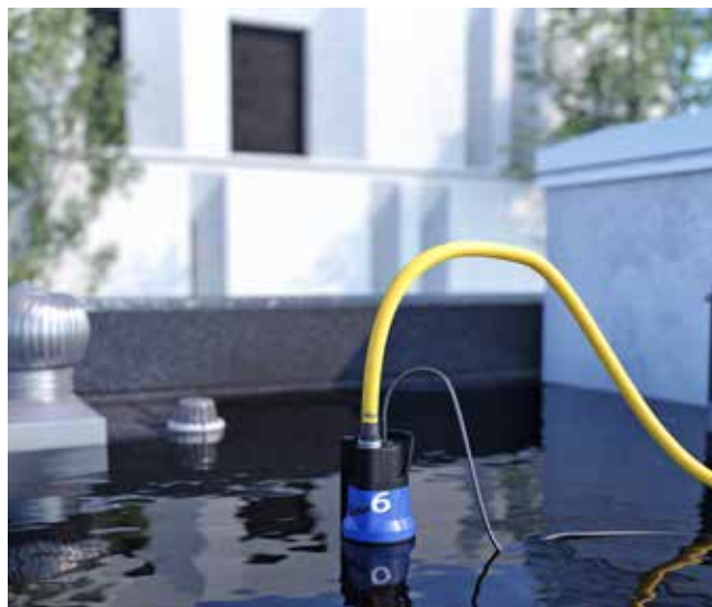
■ Wodę deszczową można szybko usunąć z płaskich dachów