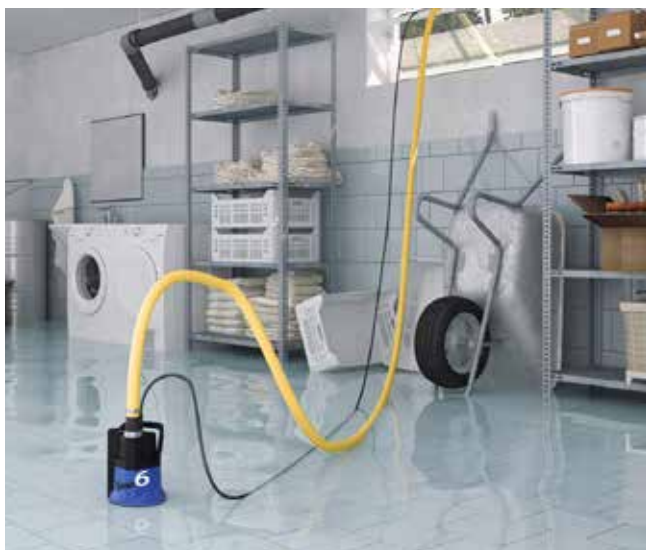
■ Zawsze pod ręką na wypadek zalania piwnicy