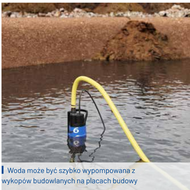
■ Woda może być szybko wypompowana z wykopów budowlanych na placach budowy