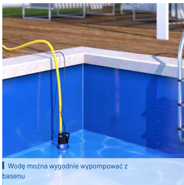
■ Wodę można wygodnie wypompować z basenu