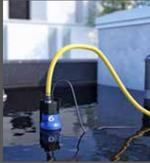
Bei Regenwasser auf Terrassen und Flachdächern