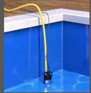
Zum Leerpumpen von Swimming-Pools