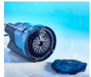
Einfache Reinigung durch abnehmbaren Siebfuß