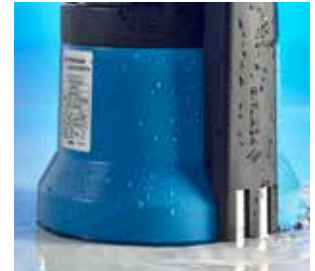
6 S: Niveausteuerng zum automatischen Ein- und Ausschalten