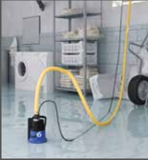
Bei Überschwemmungen im Keller