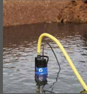
Zum Abpumpen unter Aufsicht auf Baustellen