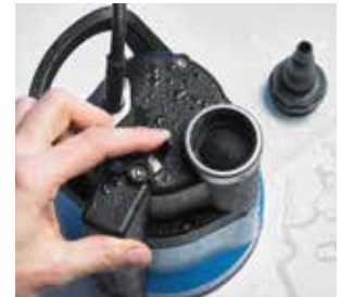
6 S: Einfacher Wechsel Hand-/Automatikbetrieb per Schalter